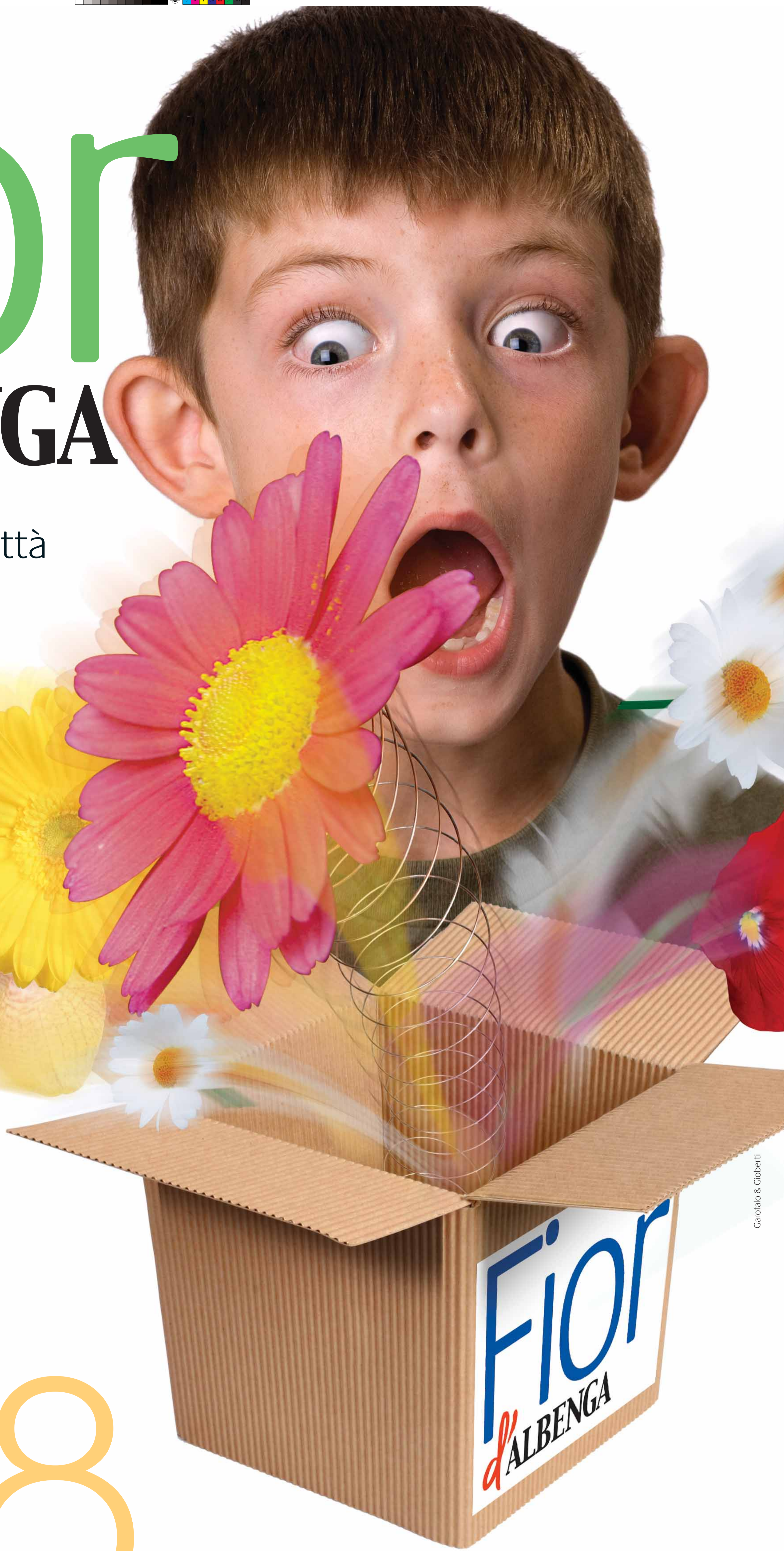
Carofalo & Gioberti