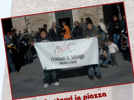
Centauri in piazza