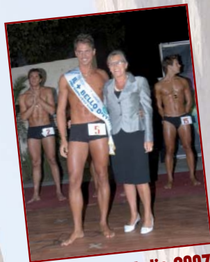
Il +bello d'Italia 2007