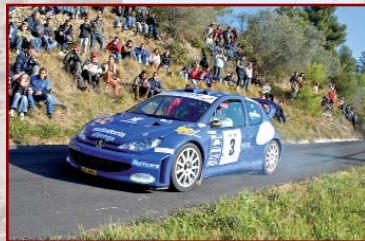
Rally Ronde Città di Albenga