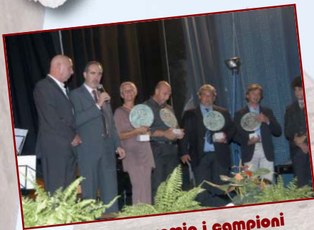
Il Sindaco premia i campioni dello sport