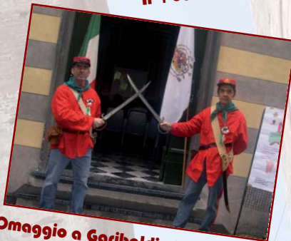
Omaggio a Garibaldi al San Carlo