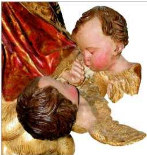
Nella foto: Un particolare della statua del Maragliano tra le opere in esposizione nella mostra "Angeli"

Con maggio si è inaugurata la mostra iconografica inerente il culto di San Calocero. Protomartire ingauno è stato oggetto di un interessante studio sulla devozione popolare. Prodotto in collaborazione con il Comune di Caluso, piccolo borgo del Canavese, l'evento ha rappresentato un importante momento di confronto e arricchimento per le due comunità. Numerose, dunque, le iniziative promosse, altri ancora i sentieri battuti, e molti i progetti in fase di definizione per i prossimi mesi. Qualche esempio? Il mercatino di Natale e nuove mostre artistico - culturali di notevole rilievo, che sapranno attirare nella nostra città moltissimi visitatori. ✍