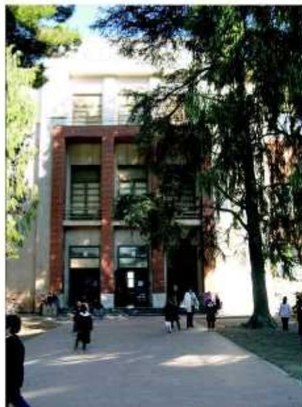
Nella foto: Il Plesso Scolastico delle Scuole Paccini è stato interessato da importanti lavori di ristrutturazione

Il piano triennale delle opere varato dall'Amministrazione prevede inoltre per il 2004 l'inizio dei lavori per il plesso scolastico di Campochiesa (per un importo complessivo di 635.241,99 Euro), intervento che interesserà la messa in sicurezza dell'edificio e l'ampliamento dello stesso con la creazione di nuove aule. ✍