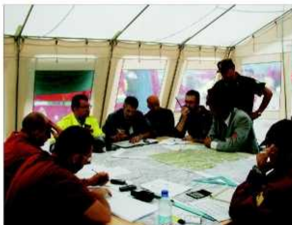
Nella foto: La squadra di Protezione Civile comunale impegnata in una riunione operativa.

l'Amministrazione ha deciso di trasferire il centro operativo da cui saranno condotte e coordinate le operazioni di soccorso, da regione Ledoga, ad una sede più efficiente e conforme alle leggi in materia di protezione civile e quindi ubicata in zona antisismica, non soggetta ad inondazioni e autonoma. Sarà infatti realizzato un nuovo centro, secondo canoni moderni, in regione Pratogrande.✍