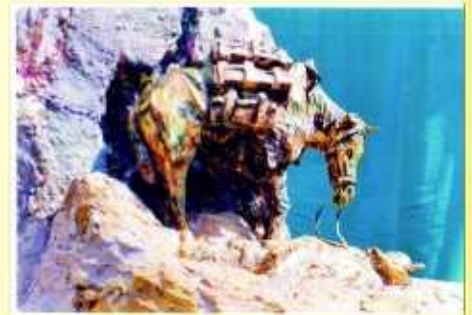
Nella foto: La statua dedicata agli Alpini realizzata dal fotografo e scultore Flavio Furlani

La scultura (1 mt x 1 mt.) poggia su un blocco di marmo rosa di Nava dal peso di 19 tonnellate e altezza 3,50 mt. Con grande sensibilità Flavio Furlani è riuscito in questa sua opera a ritrarre in modo reale e profondo il dolore misterioso di una morte cruenta ed ingiusta.