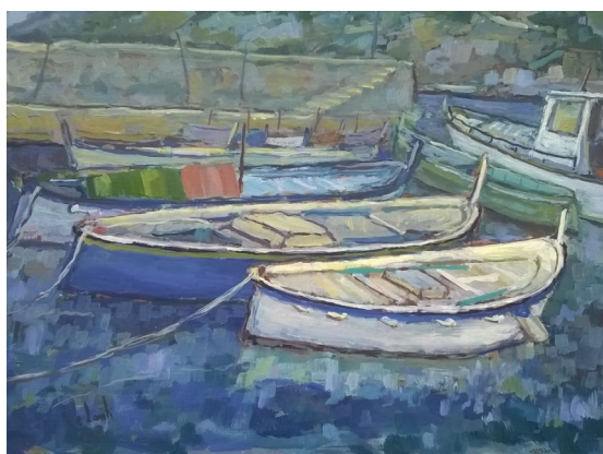
DE LONTI VINICIO