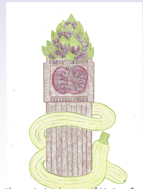
Una variazione ingauna sul Big Ben, di Simona Catalano