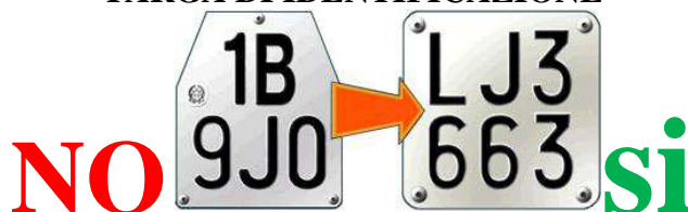
TARGA DI IDENTIFICAZIONE

N.B. Il ciclomotore deve essere obbligatoriamente coperto da ASSICURAZIONE R.C. e il conducente deve sempre avere al seguito il certificato (polizza) e il contrassegno assicurativo