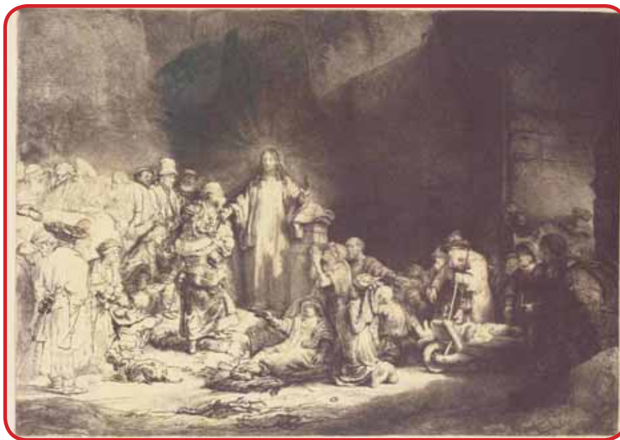
Cristo guarisce i malati- 1649

"L'Angelo appare ai Pastori" (1634) è la prima acquaforte notturna che avrà una grande importanza nei lavori futuri, specialmente dal 1640, dove cambia frequentemente nuove tecniche e sviluppa il gusto per le scene notturne.